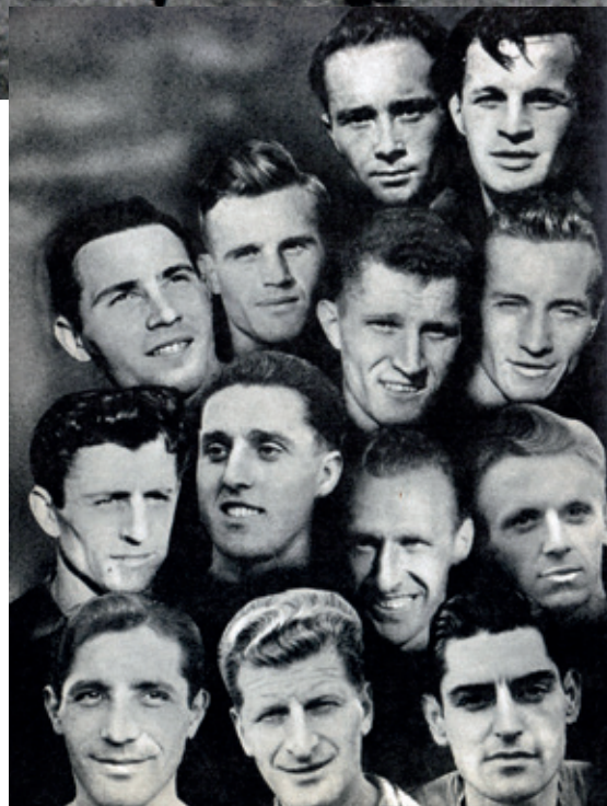
PORTRÉTY ČLENOV TÍMU SOKOLA NV BRATISLAVA, KTORÝ V ROKU 1949 ZÍSKAL PRVÝ TITUL MAJSTRA ČSR.