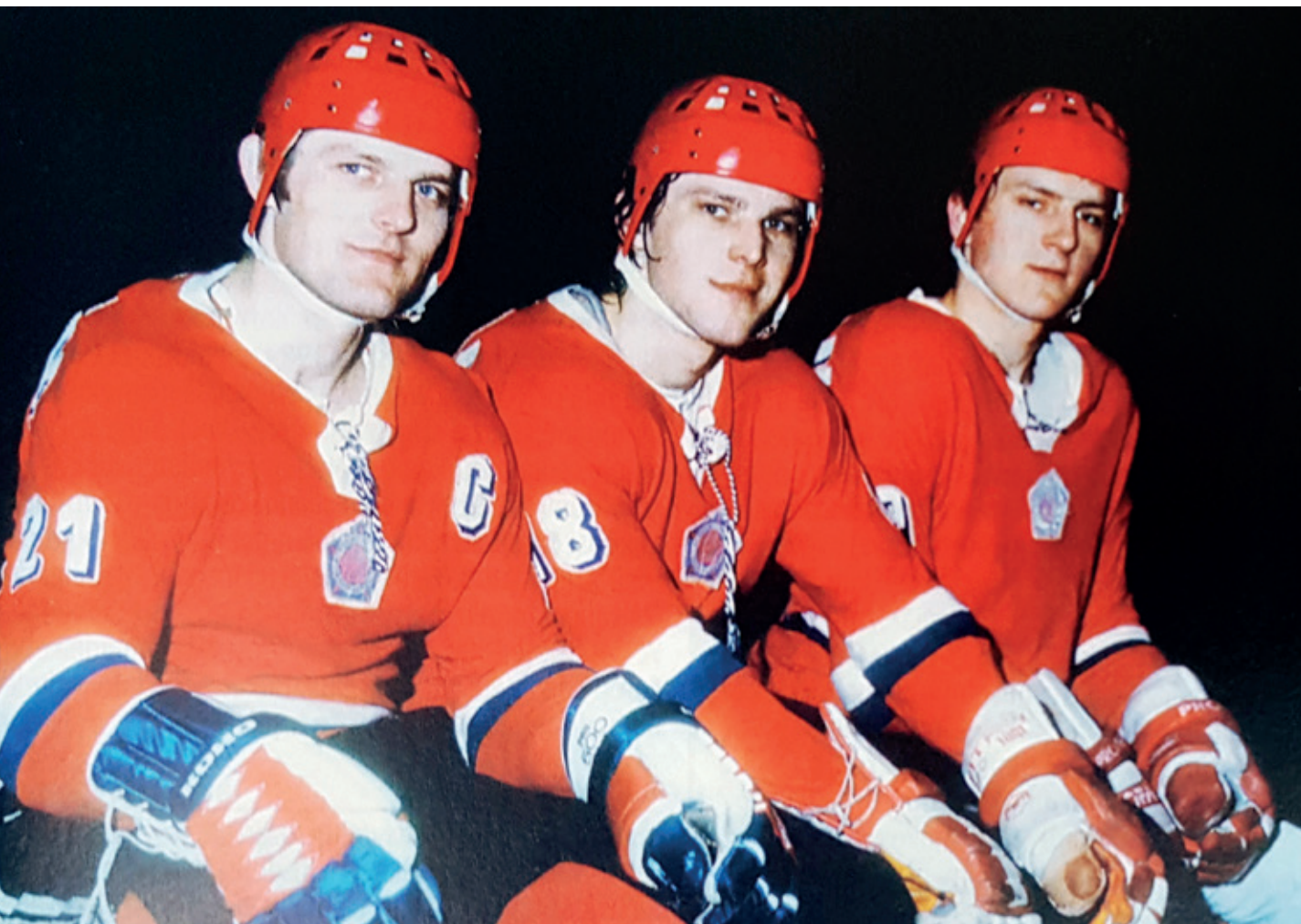
LEGENDÁRNE HOKEJOVÉ TRIO BRATOV (ZLAVA) MARIÁNA, PETRA A ANTONA ŠŤASTNÝCH „PRESTRIEĽALO“ SLOVAN K HISTORICKÉMU LIGOVÉMU TITULU V ROKU 1979.