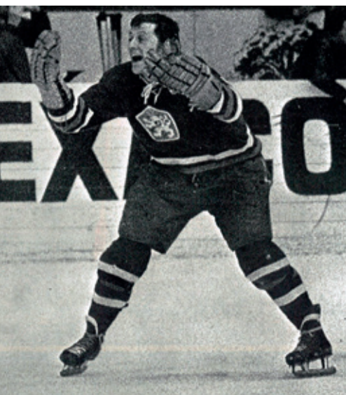
LEGENDÁRNY HOKEJISTA SLOVANA JOZEF GOLONKA BOL V TÍME ČSSR AJ KAPITÁNOM.