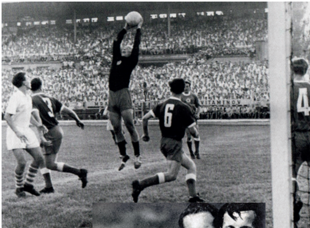
KEĎ HRAL SLOVAN NA TEHELNOM POLI, TRIBÚNY BÝVALI ZVÄČŠA PREPLNENÉ.