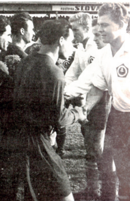
ZA ŠK HRAL AJ NAJSLÁVNEJŠÍ FUTBALISTA SLOVENSKEHO PŮVODU LADISLAV KUBALA. NA SNÍMKE V POPREDÍ PRED ZÁPASOM S CDKA MOSKVA V ROKU 1947.