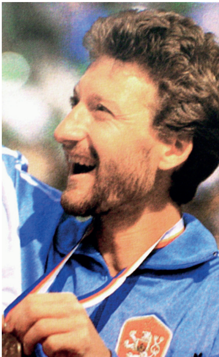
TENISTA MILOŠ MEČÍŘ JE ĎALŠÍM OLYMPIJSKÝM VÍŤAZOM Z NAJSLÁVNEJŠIEHO SLOVENSKEHO KLUBU.