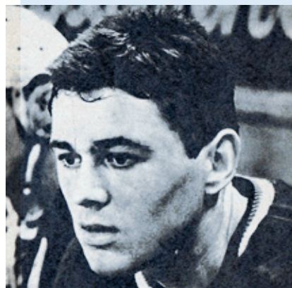
NA HOKEJOVÉHO KANONIERA Z HODONÍNA VÁCLAVA NEDOMANSKÉHO NA STAROM ZIMNOM ŠTADIÓNY DAVY KRIČALI „VENCO, BANÁN!

Cvetlera, Hrivnáka a Jána Čapkoviča 3:2. Ústrednými postavami víťazného tímu boli kapitán Alexander Horváth a brilantný technik Karol Jokl . Slovan získal európsku trofej ako vôbec prvý futbalový klub z Východnej Európy!