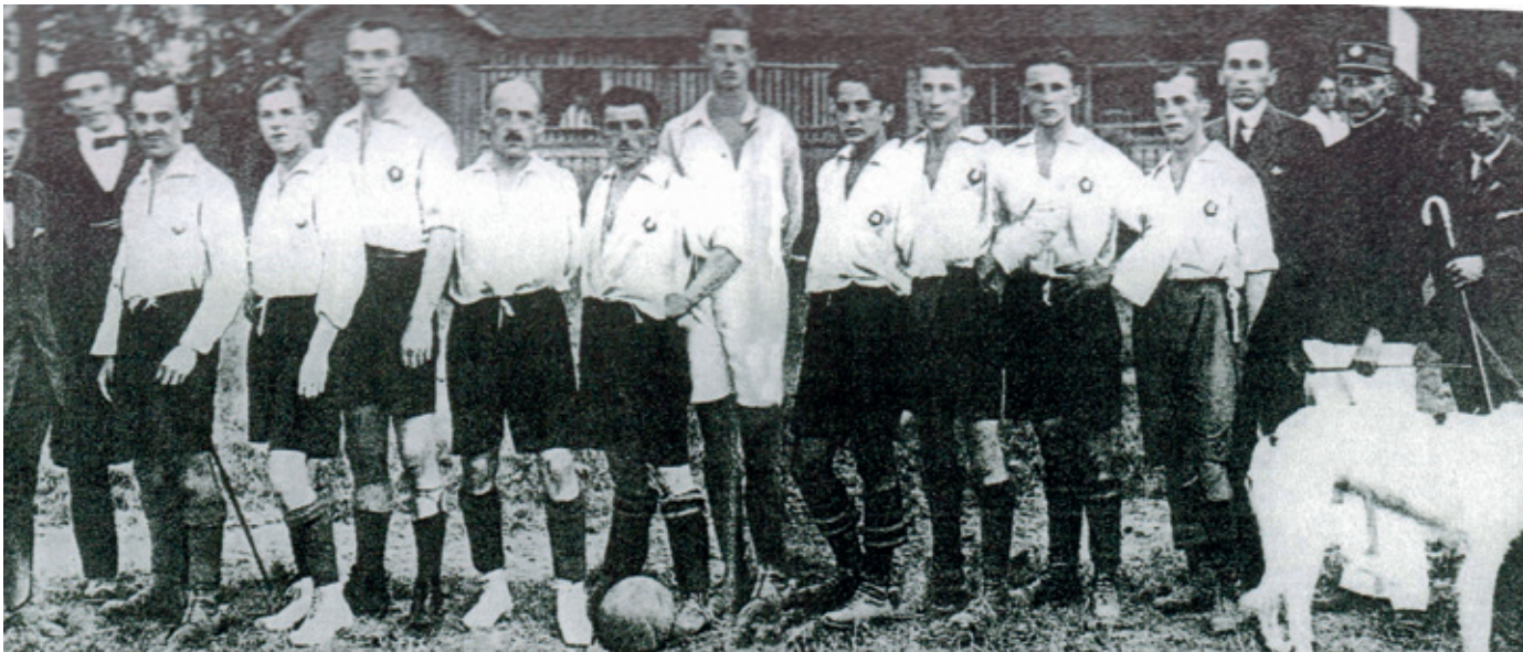
ZNAČKA 1. ČSŠK SA OD ROKU 1919 SPÁJALA LEN S FUTBALOM, NESKÔR PRIBUDLI ĎALŠIE ŠPORTY.

Z lomový význam mal pre rozvoj športového hnutia na Slovensku vznik Československa v roku 1918. Športový vývoj na národnej báze dovtedy nemal šancu. Prvé telovýchovné spolky a športové kluby na našom území boli maďarské a nemecké.