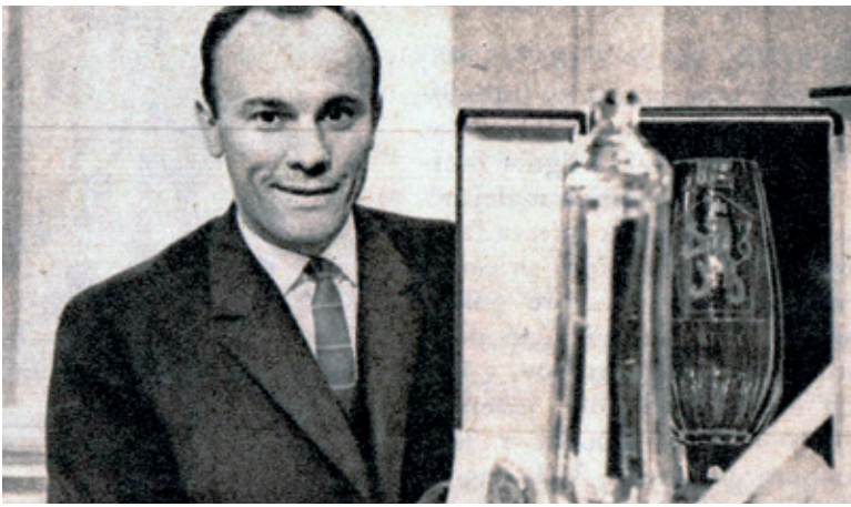
SLOVENSKÝ FUTBALISTA STOROČIA JÁN POPLUHÁR S TROFEJOU NAJLEPŠIEHO FUTBALISTU ČSSR 1965.