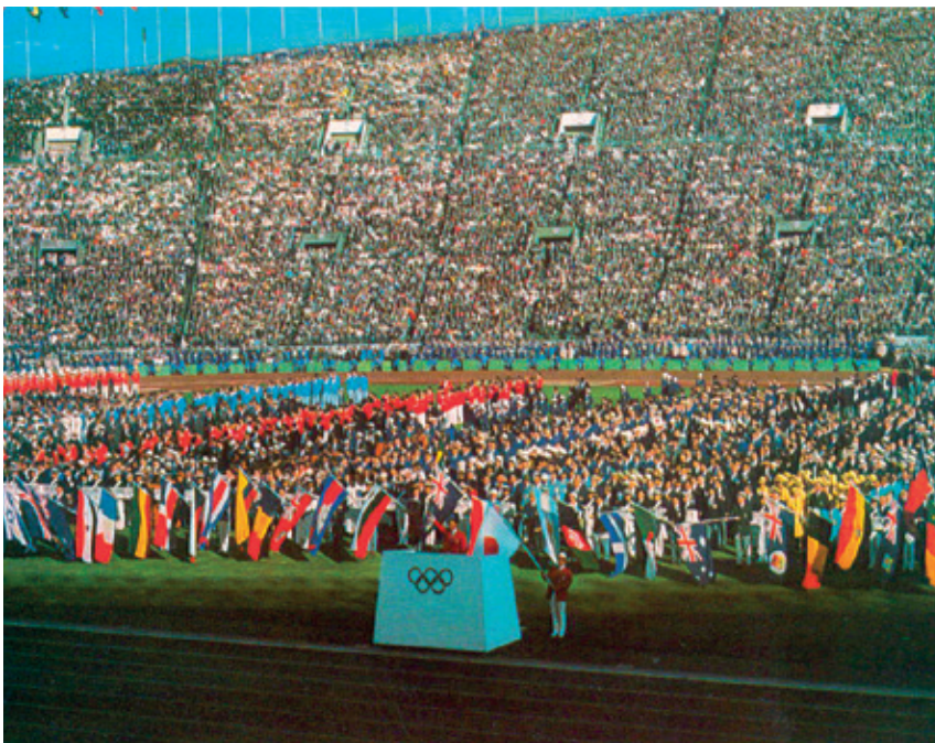
MOMENTKA ZO SLÁVNOSTNÉHO OTVORENIA OH 1964.

Donald Schollander (USA, plávanie) 4-0-0 , Věra Čáslavská (ČSSR, športová gymnastika) 3-1-0, Jukió Endó (Jap., šp. gymn.) 3-1-0, Sharon Stouderová (USA, pláv.) 3-1-0, Stephen Clark (USA, pláv.) 3-0-0, Larisa Latyninová (ZSSR, šp. gymn.) 2-2-2, Polina Astachovová (ZSSR, šp. gymn.) 2-1-1.