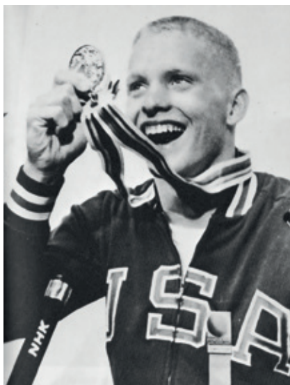
MEDAILOVO NAJÚSPEŠNEJŠÍ ÚČASTNÍK HIER, PLAVEC USA DON SCHOLLANDER.

Japoncov o možnosť vyhrať všetky štyri vtedajšie disciplíny nového olympijského športu. Súťažilo sa v legendárnej hale Nippon Budokan, ktorá počas OH 2020 bude dejiskom nielen súťaží džudistov, ale aj karatistov – tí sa pod piatimi kruhmi predstavia premiérov.